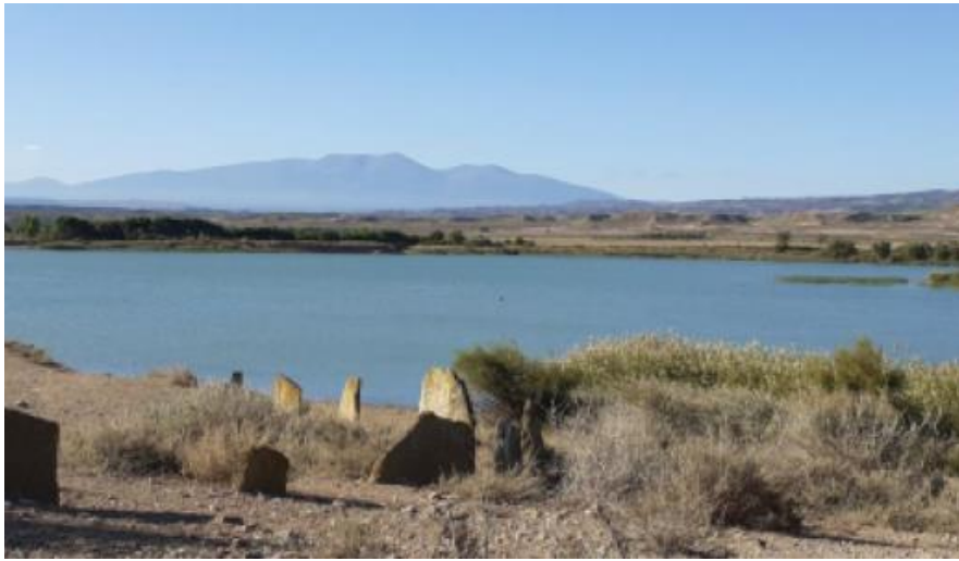
Tipo: Balsa | Situación: Tudela

La Balsa el Pulguer es Lugar de Importancia Comunitaria (LIC) y Reserva Natural desde 1987. Es la zona de baño más meridional de Navarra, con un clima preferentemente árido. Es un humedal de gran importancia para las aves, en concreto es el mayor dormitorio de cigüeña común de Navarra. Su origen se remonta a 1627 cuando se construyó la balsa para riego. La temperatura del agua en verano oscila entre los 22 y 26°C. Presenta una salinidad media-alta. La práctica de deportes acuáticos está delimitada con unas boyas. Ideal para pasar el día en contacto con la naturaleza, darse un chapuzón en sus aguas, nadar o navegar en kayak o windsurf, etc.